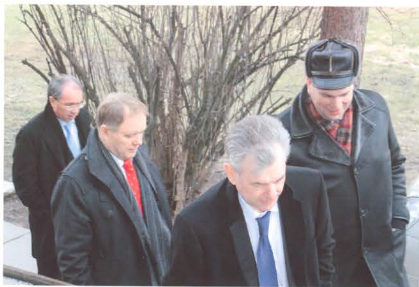
Нашим гостям понравилась и территория студгородка, его ограждение