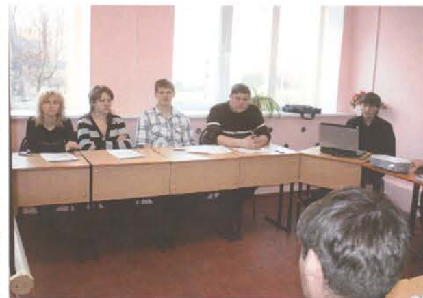
Заседание студсовета продолжается

лах, о проделанной работе и о планах мероприятий на осень. А с 1 сентября основное внимание каждого комитета будет направлено на вновь заселяющихся студентов. Планируется большая совместная и продуктивная работа. Ведь проявление активных действий формирует не только окружение и среду, в которой общаешься,