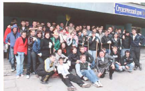
Ребята из «девятки» всегда принимают активное участие в субботниках

Ну и, как говорится, по труду были и поощрения и угощения: заведующие студенческими домами угощали ребят