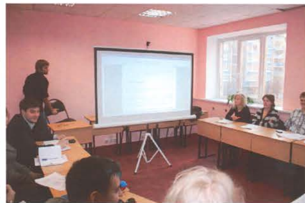
Идет заседание студенческого совета городка

В июне 2009 года состоялось итоговое собрание главного комитета студсовета, на котором каждый председатель и глава комитета подробно рассказал о своих де-