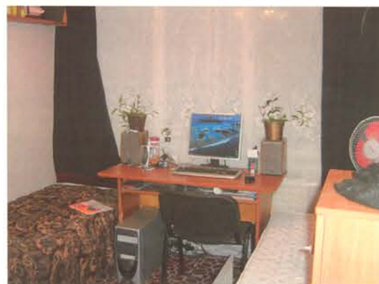
будет также важным источником информации и базой для общения между студентами.

Служба поддержки ежедневно принимает заявки на подключение. Отдельно хочется высказать слова благодарности руководству провайдера. Помимо подробной консультации по телефону, они проводят встречи со студентами, на которых обсуждаются как «железные проблемы», так и обычные вопросы услуг интернета. Совсем недавно по итогам одной из таких встреч скорость интернета увеличили вдвое, оставив прежние расценки. Помимо этого руководство «Iwap» совместно с ГУ «УМСГ» в качестве поощрения некоторых студентов за активную работу в Межвузовском студенческом городке, предоставляет возможность выходить в интернет бесплатно. На сегодняшний день не дается все возможное, чтобы студенты МСГ шагали в ногу со временем и были в курсе событий в стране и в мире. В планах намного больше: расширить и без того разнообразную тарифную сетку и запустить интернет TV. Совсем скоро запускается сайт МСГ, который