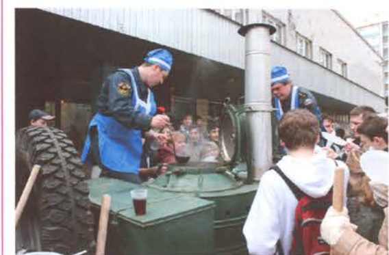
Сытное питание никогда не помешает после хорошей работы

Кипела работа и в жилых корпусах: ребята мыли стены на центральных лестницах, приводили в порядок двери своих комнат и сами комнаты.