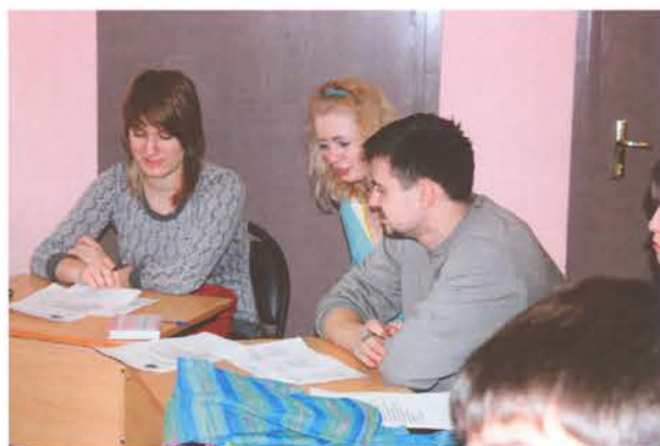
Студенческие активисты советуются по наиболее важным и перспективным вопросам

Сегодня уже никому не нужно доказывать, что жизнь и состояние нашего Межвузовского студенческого городка значительно изменились в лучшую сторону. Конечно, в этом процессе весьма важной, основополагающей является деятельность администрации, руководству МСГ, но имеется и еще один немаловажный фактор современного развития городка — это студенческое самоуправление. Иначе говоря, самоотверженная, бескорыстная работа студенческих объединений: студсовета МСГ, студсоветов студенческих домов, старостатов по этажам, студентов-активистов и др.