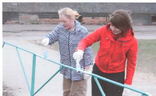
Освоение студентами второй профессии

ездах, посадили много саженцев и кустов рядом со своими корпусами.