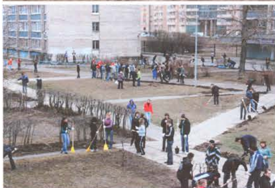
Работы велись по всему фронту студгородка

Похорошели все студенческие дома. Будущие специалисты вдумчиво и серьезно, как это и полагается им по профессиям, красили ограждения, обновляли стены в подъ-