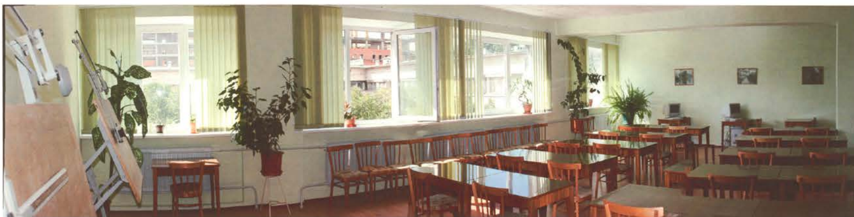
Читальный зал отремонтированной библиотеки

Заниматься учебой в вузе — весьма важно и перспективно. Придя с лекций, отдохнув и позанимавшись бытовыми проблемами, сознательный, уважающий себя и свою будущую профессию студент испытывает, несомненно, настоятельную потребность самообразования. В Межвузовском студенческом городке для этого тоже есть все необходимое. Во-первых, работает весьма солидная, с многотысячным книжно-журнально-газетным фондом библиотека. Особенно она активизирует свою деятельность, оказывая различного рода помощь и услуги в период сессии. Об этом, в частности, говорит и объявление о времени возобновления ее работы: