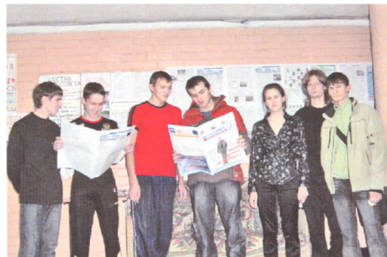
Студенты общежития читают газету