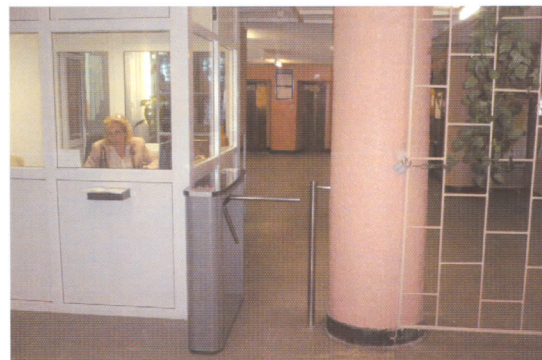
Вахта в студенческом доме

А это конференц-зал в Молодежно-досуговом центре студгородка, в котором могут разместиться около шестисот ребят и проводиться различного рода культурно-массовые мероприятия