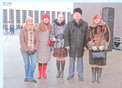
Начинали программу популярные телеведущие, которые сразу отметили, что

Грандиозный праздник в Ледовом дворце с участием знаменитых певцов и телеведущих не оставил равнодушным ни одного студента. В этот вечер тысячи веселых ребят находились в ожидании чего — то интересного и увлекательного, ибо сам дворец уже подразумевал собой масштабность мероприятия, а его красота и величие подчеркивали особую важность и значимость.