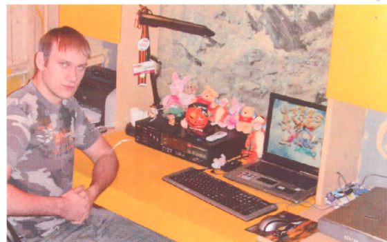
Интернет проведен в каждую из 2700 комнат студгородка

Мы уверены, что выборы Президента — не просто политическая кампания, это исторический выбор дальнейшего пути развития России. Мы, председатели студенческих домов Межвузовского студенческого городка, призываем всех, прийти на выборы, выполнить свой гражданский долг и сделать правильный осознанный выбор, от которого будет зависеть будущее России и нас самих.