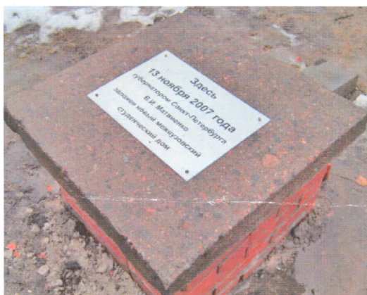
Здесь по решению Губернатора СПб В.И. Матвиенко начато строительство современного студенческого дома