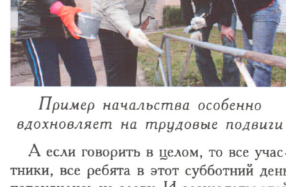
Пример начальства особенно вдохновляет на трудовые подвиги

А если говорить в целом, то все участники, все ребята в этот субботний день потрудились на славу. И результаты этой бескорыстной работы были налицо: территория городка и жилые корпуса стали выглядеть чище, ухоженней. Да и сами ребята после работы на воздухе, на солнышке стали выглядеть похорошевшими и посвежевшими. Ну, а в итоге заведующими студенческими домами были приготовлены соответствующие угощения из каши с тушенкой и чаепития, что в общем тоже способствовало их хорошему, приподнятому настроению.