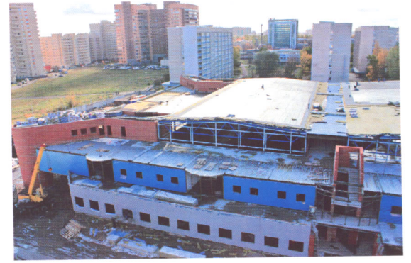
Панорама строительства нового студгородка

«Научные и научно-педагогические кадры инновационной России. 2009 — 2013 годы.»