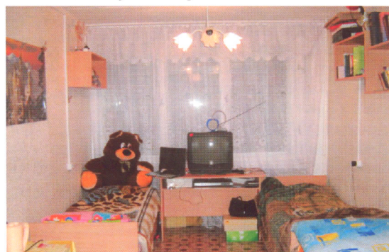
Впервые капитально отремонтировано свыше 1500 жилых комнат

Сегодня студенческий городок выглядит весьма впечатляюще: в 10 многоэтажных жилых корпусах проживает около восьми тысяч студентов, питомцев свыше 20 вузов Санкт-Петербурга, в том числе около 300 иностранных студентов. Обслуживают городок около 400 наших сотрудников, трудом и стараниями которых в городке созданы все условия для жизни, отдыха и занятий в послеучебное время.