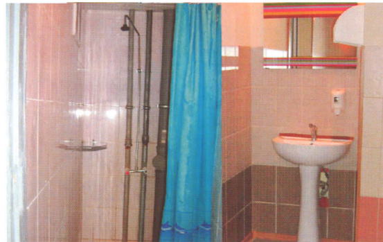
Таких душевых в МСГ впервые построено свыше 300

Особым направлением в функционировании студенческого городка явилось широкое применение различных форм студенческой демократии и самоуправления. В настоящее время действует студенческий совет городка, студенческие советы в корпусах, старосты по этажам, являющиеся серьезными помощниками и советчиками администрации. Знаменательным событием явилось создание студенческого молодежного отряда правопорядка (МОП) по охране и патрулированию территории студгородка.