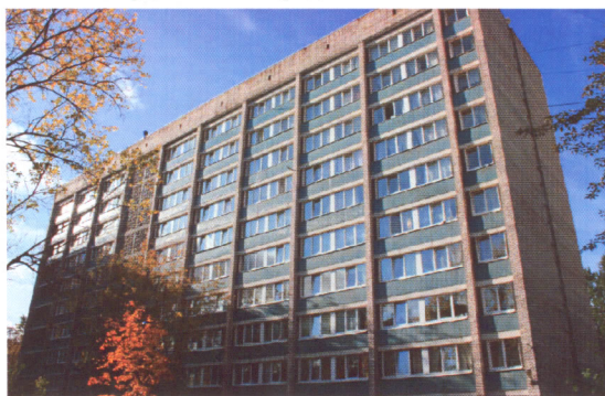
Все 10 корпусов получили второе рождение и с новыми пластиковыми окнами выглядят как новые

Наша страна поставила перед собой ответственную задачу: перейти на путь инновационного развития, чтобы уже сегодня войти в число стран — лидеров глобального информационного пространства. Однако для этого необходимо, прежде всего, весьма интенсивное развитие отраслей, требующих высококлассных специалистов и конкурентоспособности на мировом уровне. Именно для этого Вы и поступили для обучения в крупнейшие вузы нашего славного, героического Санкт-Петербурга. Мы тоже пошла Вам навстречу, предоставив возможность проживания в одном из уникальнейших, единственном в России студенческом городке.