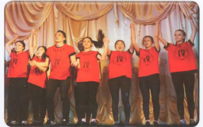
Победители танцевального конкурса 2014 года - команда 4 корпуса

От души поздравляем и благодарим всех наших артистов, организаторов и администрацию городка за то, что