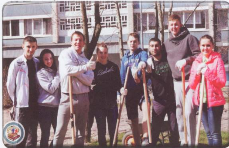
После ударного труда можно и сфотографироваться