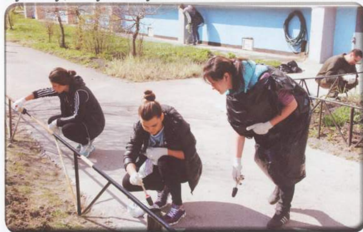
Не боги красили ограждения - а наши студенты на трудовом субботнике