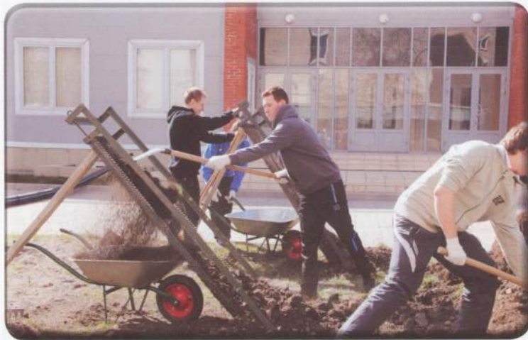
А мы землю сеяли, сеяли и от мусора просяеали...

городка. Организаторы постарались, ребята горели энтузиазмом, танцевали, подпевали, бодро пританцовывал и сам Иван Фёдорович. Номера успешно собрали обширную публику. Постаралась и съёмочная часть нашего медиацентра — видео и фото были сняты. И как в последнее время повелось, финишировали зажигательным флешмобом от