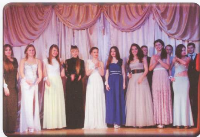
На сцене конкурсантки всех студенческих домов Межвузовского студгородка

По задумке организаторов мероприятия этой команде ведущих предстояло