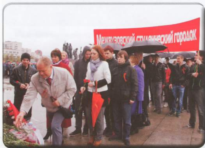
Студенты и сотрудники Межвузовского студгородка на возложении цветов в честь праздника Победы

Традиционно, в преддверии 9 мая, в Московском Парке Победы прошло возложение цветов к памятнику прославленному Маршалу Советского Союза Георгию Константиновичу Жукову. Межвузовский студенческий городок также принял участие в церемонии возложения цветов, пройдя строгой, многочисленной колонной по центральной аллее парка (Аллее Героев). После речи, посвященной героизму советского народа, и последовавшей за ней минуты молчания, участники праздничного меро-