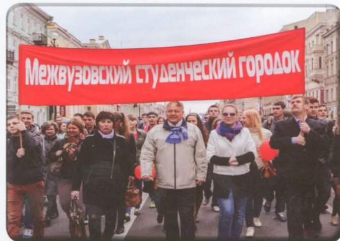
Колонна Межвузовского студенческого городка на первомайской демонстрации

поранты, флаги и воздушные шары радовали глаз и грели душу участников демонстрации и зрителей. По мере приближения к конечному пункту шествия погода становилась все теплее, видимо,