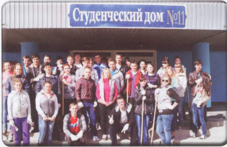
Фотография на память о субботнике в Межвузовском студенческом городке