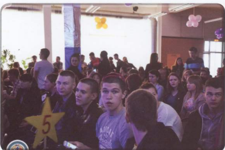
Болельщики Межвузовского студентского городка - действенная, активная сила любых мероприятий

и жюри предстояло сделать непростой выбор. А пока оно совещалось и выбирало победительницу на сцене про-