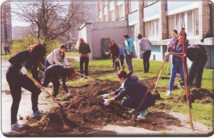
Основная черта студенческого субботника - его массовость

В преддверие майских праздников по всей стране прошли субботники. Наш студгородок не стал исключением. К назначенному времени на улицу высыпали первые группки тружеников. Все еще сонные, ребята в буквальном смысле, выползали на улицу. В течение получаса к первоприходцам присоединилась основная часть ещё полусонных тел и