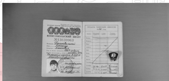
Что такое комсомол Страница 6