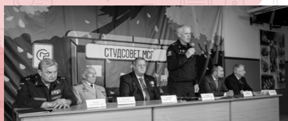
Встреча ветеранов Космических войск Страница 10