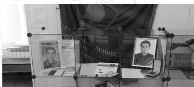
Назад в ВЛКСМ! Страница 14