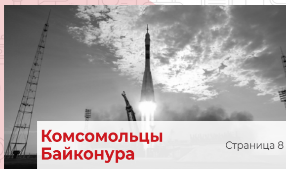
Комсомольцы Байконура Страница 8